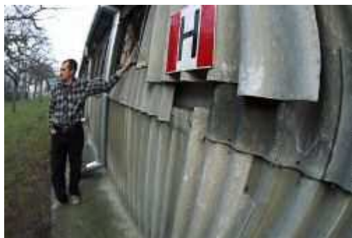
Znaczne uszkodzenia powierzchni azbestowych płyt falistych na dachu budynku: