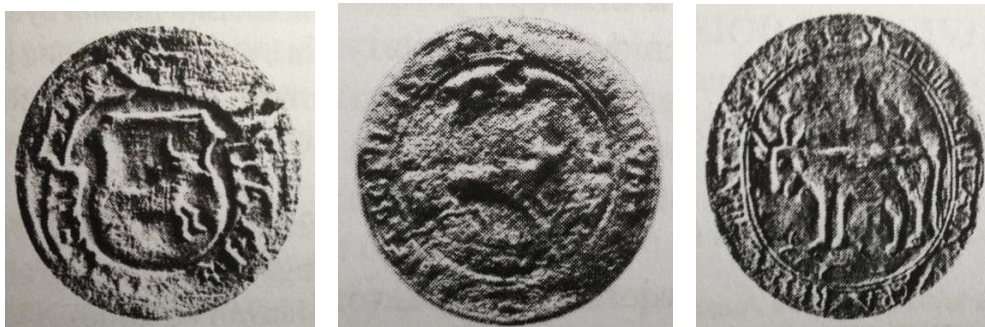
a) Pieczęć herbowa Bielska 1577 r. b) Pieczęć herbowa Bielska 1616 r. c) Pieczęć miasta Bielska 1778 r.

Ponadto naturalnym twórczym dla projektu herbu Gminy Bielsk Podlaski może być także wykorzystanie motywu z godła pieczęci miejskich Bielska Podlaskiego ukazującego od schyłku XV aż do XX w. tura.