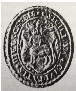
d) Pieczęć herbowa Bielska 1780 r. e) Pieczęć herbowa Bielska 1782-1791