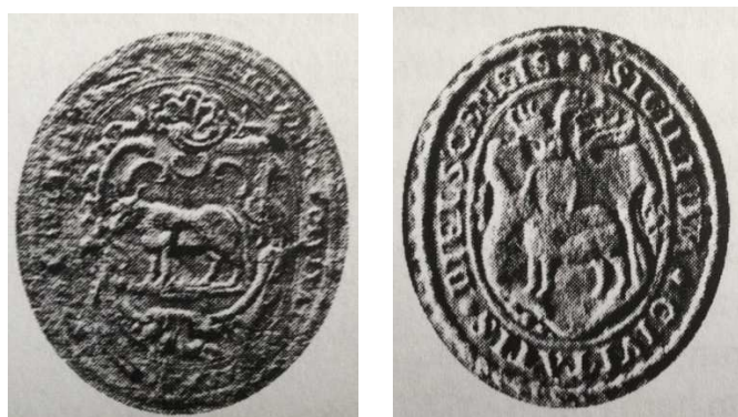
d) Pieczęć herbowa Bielska 1780 r. e) Pieczęć herbowa Bielska 1782-1791